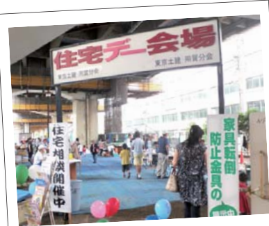
東京土建の住宅デー。区内業者の仕事おこしに住宅リフォーム助成の実施を求めています。またゼロ金利融資の延長を実施させました。