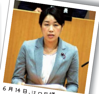
6月14日、江口区議の初質問。成城地域の特養ホームについて質問しました。