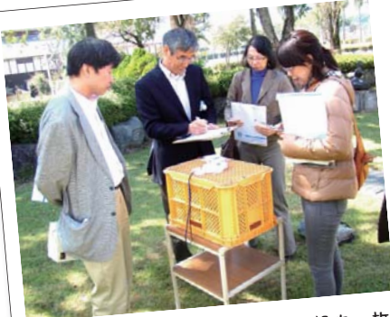
10月3日、川場村移動教室の施設内の放射線測定を行ない、ホットスポットの除染が実現しました。