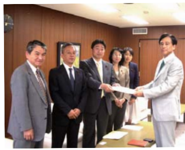
5月2日、保坂区長に被災地の救援・復興で申し入れをしました。この提案が区政をリードしました。