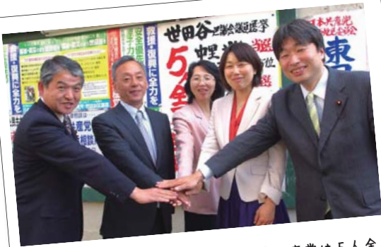
4月24日の区議会議員選挙で、日本共産党は5人全員が当選しました。区議会第3党になりました。