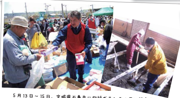
5月13日～15日、宮城県石巻市に救援ボランティアに行きました。以降7回のべ100人以上がボランティアに参加しました。