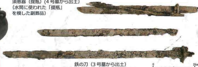
鉄の刀（3号墓から出土）