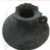
須恵器（提瓶）（4号墓から出土） （水筒に使われた「提瓶」を模した副葬品）

横穴墓の中から、葬られた人の「人骨」とともに、お弔いをするために埋めた「副葬品」が見つかりました。副葬品は、鉄の刀や矢じりなどの「武器・武器類」、首飾りなどの装飾品などです。副葬品は葬られた人の地位を象徴するものですが、多くは後の時代に盗掘されてしまい、このように多く出土するのは珍しいようです。