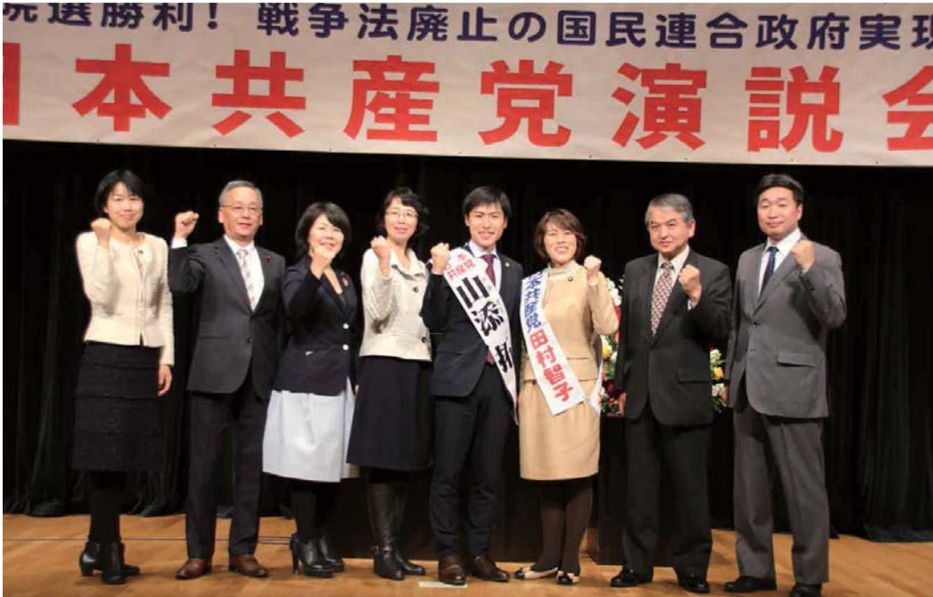
2015年12月4日、成城ホールにて日本共産党演説会を行いました。

あけましておめでとうございませ 戦争法廃止に向けた大きな一歩を踏み出す年にしま しょう。 野党共闘の実現に誠実に努力し、参院選で与野党 逆転に全力をつくします。 みなさんとともにがんばります。