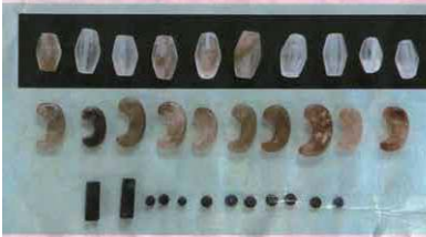
玉類（首飾りなどの装飾品）（3・4号墓から出土）