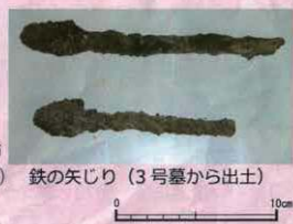
鉄の矢じり（3号墓から出土）