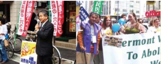
消費税増税中止の宣伝 2010年NTPニューヨーク行動に参加