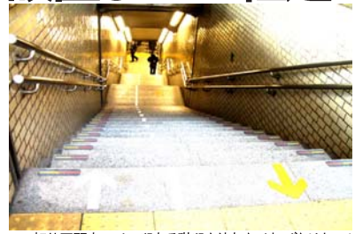
三軒茶屋駅南口は50段ある階段を使わなければなりません。エレベーターが欲しいという切実な声が多く出されています。

2013年5月「安心して利用できる三軒茶屋駅を考える会」は世田谷区長に署名を提出。